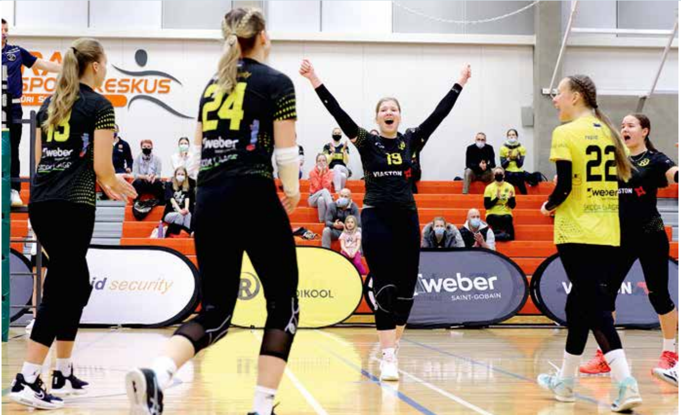
Võrkpallitüdrukud on teinud suure arenguhüppe.