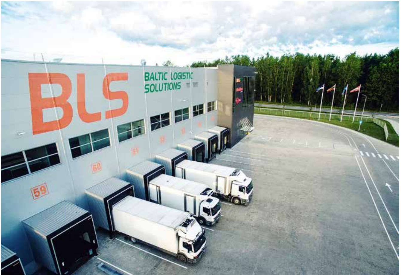
BLS loob Rae valda logistikakeskuse juurdeehitusega juurde 22 uut töökohta.