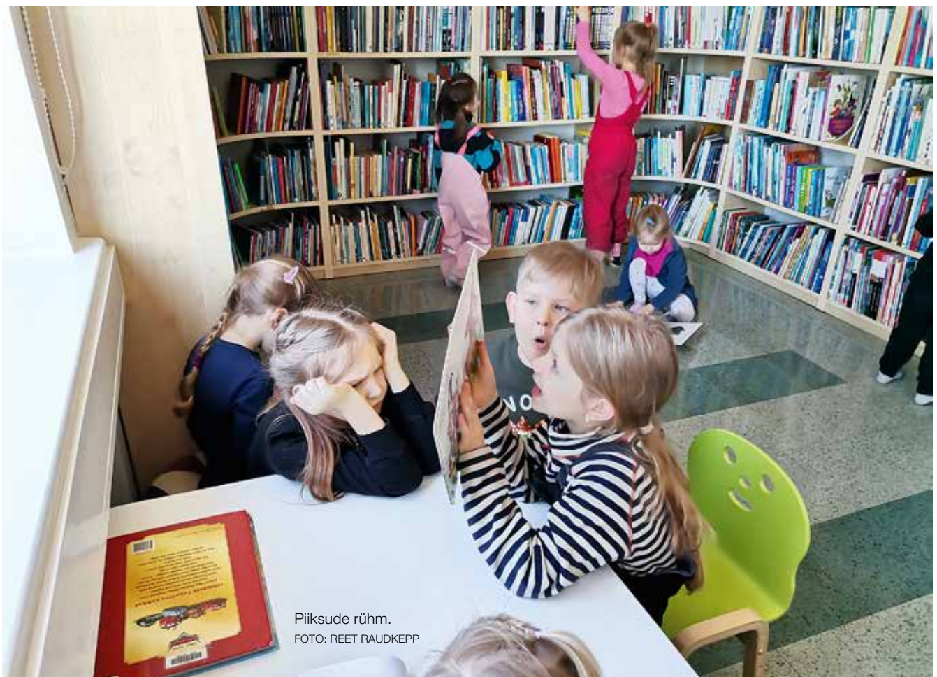
Piiksude rühm.