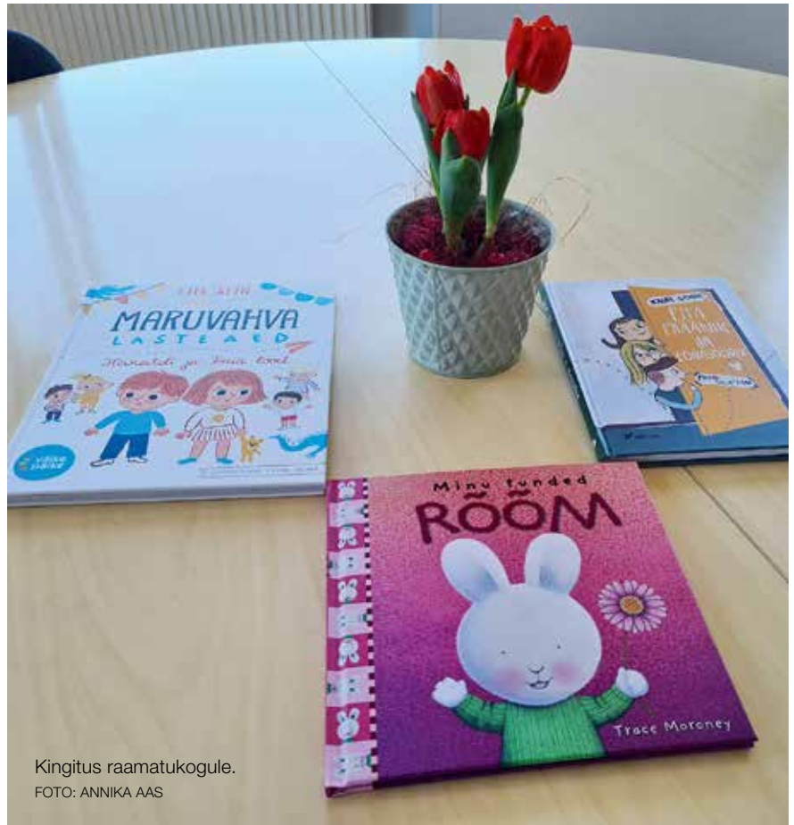
Kingitus raamatukogule.