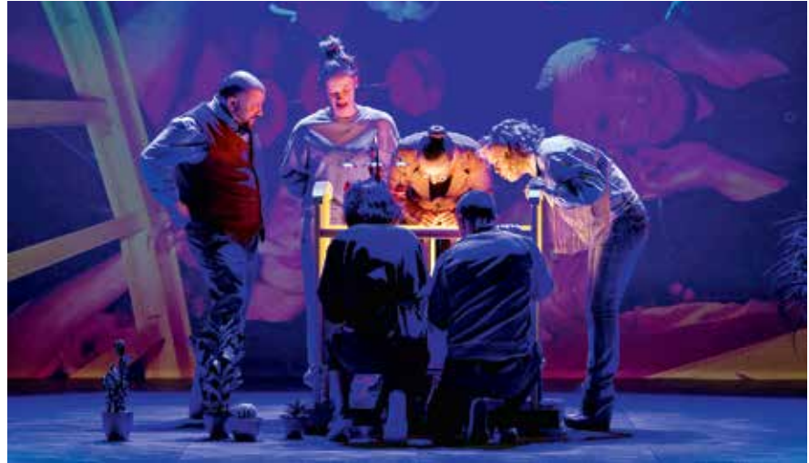
Rakvere Teater „Katk.Est. Used.“.

Koostöös Pille Lille Muusikute Fondiga süvamuusika kontserdid Rae Kultuuri-