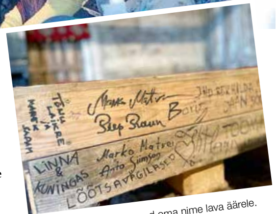
Kõik esinejad jäädvustavad oma nime lava äärel.