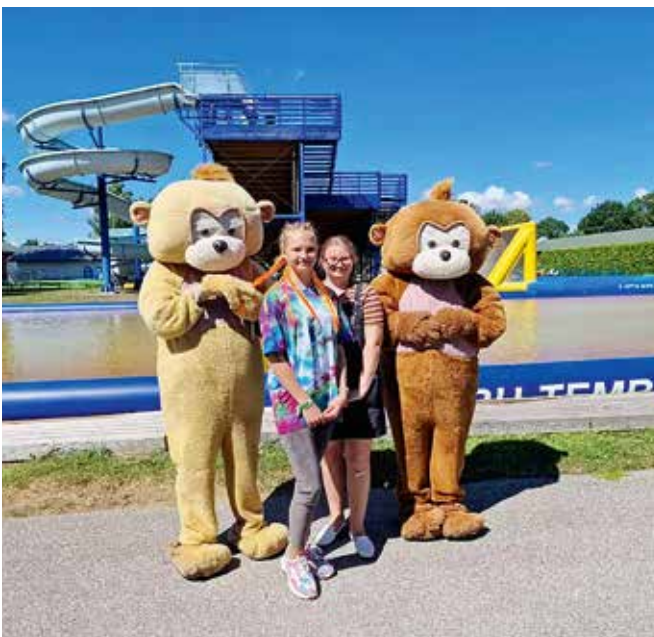
Viie Päeva Kämpis lustiti ka Vembu-Tembumaal.

4.-15. juuli toimusid päevalaagri Viie Päeva Kämpi vahetused Jüris, Järvekülas, Vaidas, Peetris ja Lagedil. Seekord olid vahetused jaotatud vanuse põhjal. Nii tegutsesid noorsootöötajad esimesel nädalal 7-10-aastaste ning teisel nädalal 11-14-aastaste noortega.