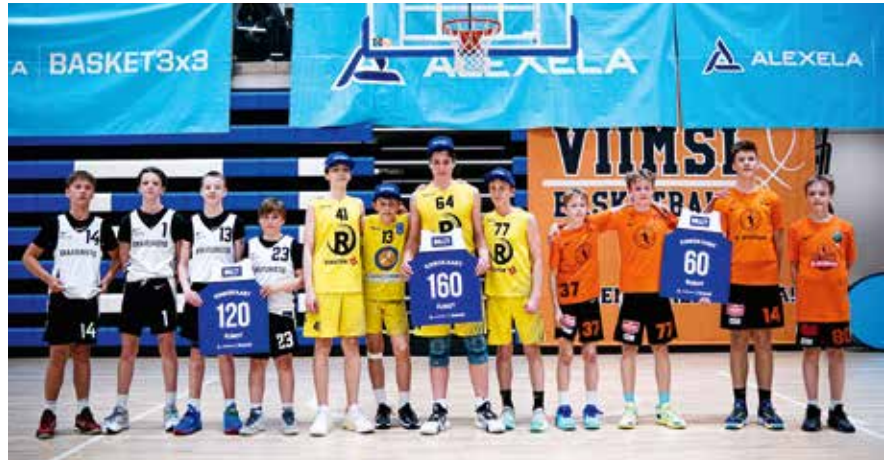
Rae/Kiili SK U13 noormehed keskel.