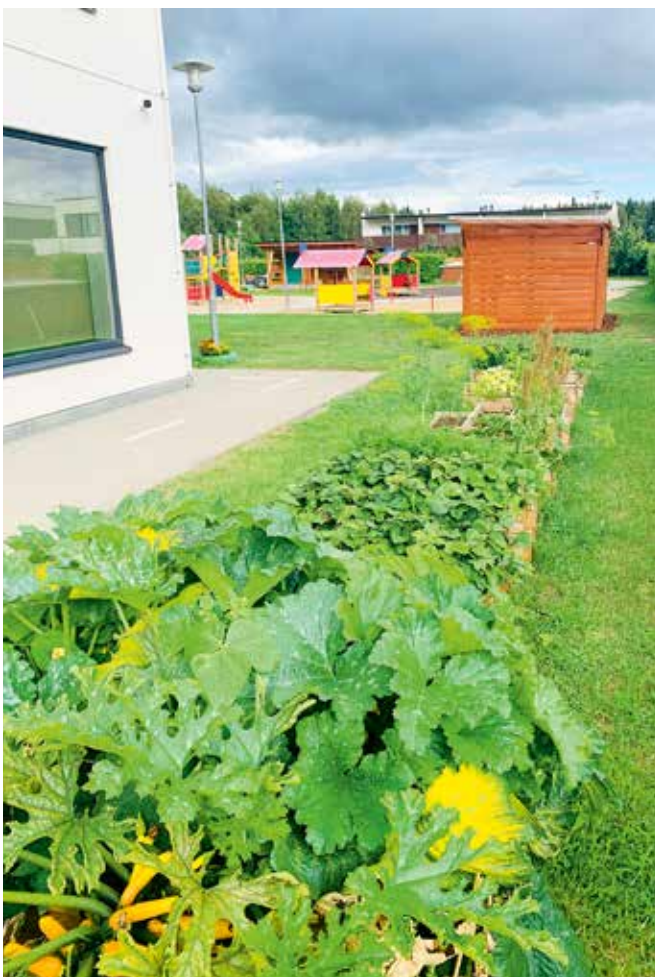
Kasvatuskastid on igal rühmal omad ning iga rühm vastutab neis kasvavate juurviljade ja maitsetaimede hoolitsemise eest.

Lasteaia õuealale sisenedes tekib tunne nagu astuksid koduaeda. Aias leidub nii ilutaimi kui ka marjapõõsaid, kasvatuskaste ning kõige selle vahel on lasteaial oma kasvuhuone. Kasvatuskastid on igal rühmal omad ja iga rühm vastutab neis kasvavate