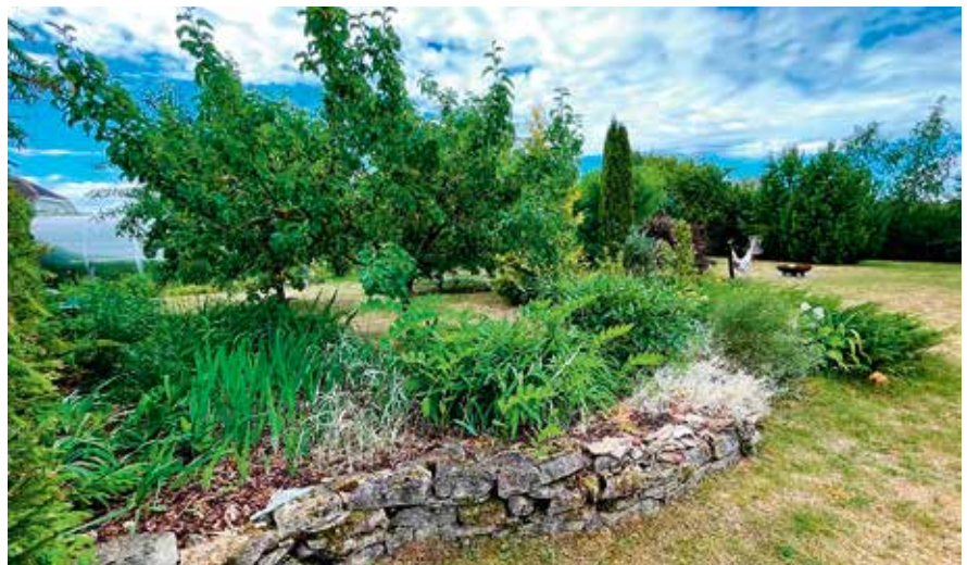
Perekond Eevardi kodu Järvekülas.

Rae valla kauneid kodusid tänatakse valla sünnipäeval novembris.