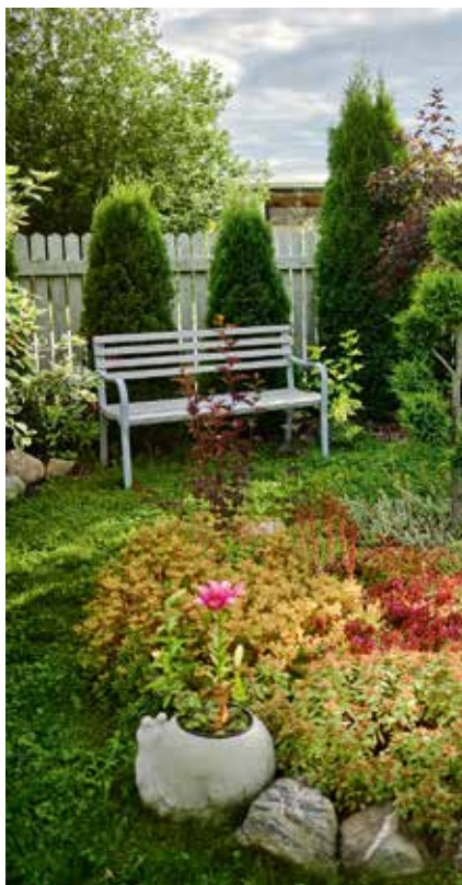
Ilu nautimiseks on mitmes aia osas loodud puhkenurk.