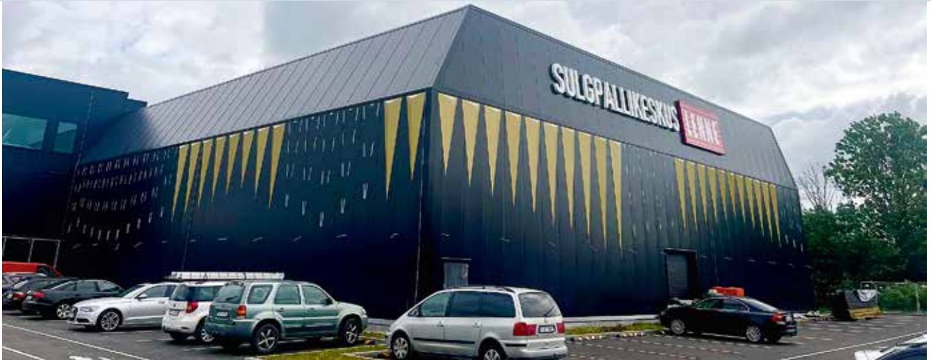
Lenne Sulgpallikeskus Jüris.