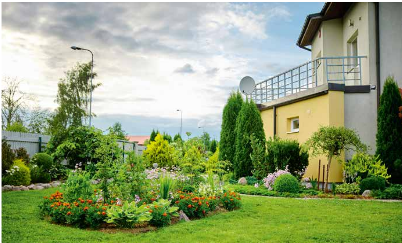
Kaunis Kodu 2022 individuaalelamu kategooria võitja.

J uulikuus selgitati heakorrakonkursi „Kaunis Kodu 2022“ võitjad. Ringsõidul tutvuti väga ilusate ja omapäraste aedadega. Kategoorias individuaalelamud läks võit sellel aastal Patika külla, kus perekond Sokolov on väga oskuslikult ühendanud ilu- ja tarbeaia üheks tervikuks. Aeda hinnanud komisjonile jäid silma kujunduslikud detailid ning juba aeda sisenedes oli näha, et perekond veedab seal palju aega ning aed on loodud hoole ja armastusega.