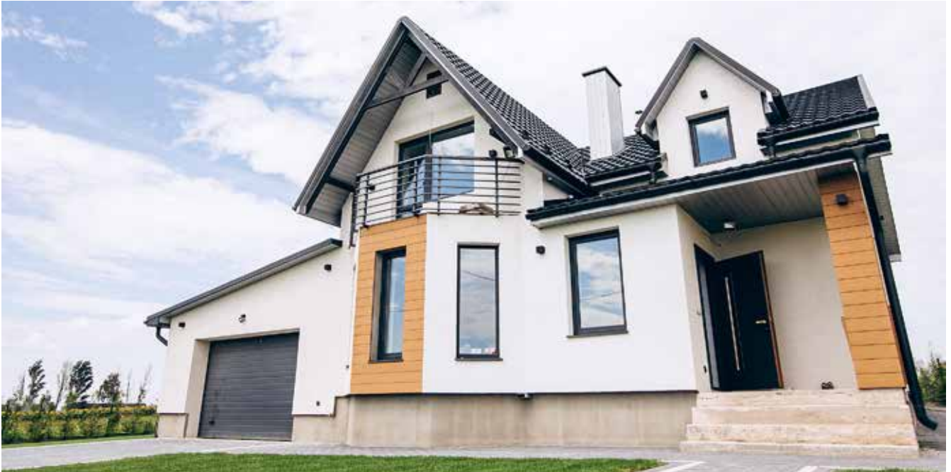
Pärast 1. juulit 2015. aastal ehitatud ehitise seadustamine toimub vastavalt kehtivale ehitusseadustikule.

Kuidas korraldada seni ehitisregistrisse kandmata ehitiste andmete korrastamist ning vajadusel ehitise seadustamist või lammutamist?