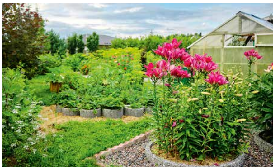
Perekond Sokolov on väga oskuslikult ühendanud ilu-ja tarbeaia.