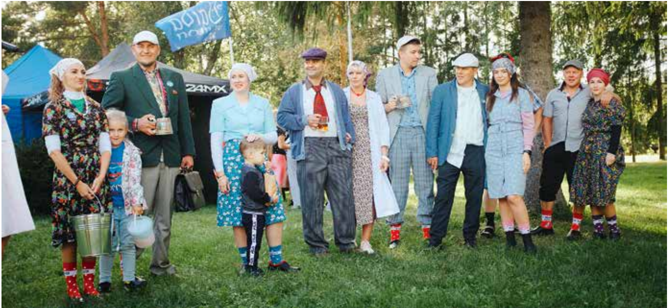
Stiilsed pidulised sovhoosi ajast.