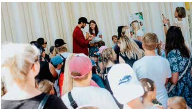
Huvi Stefani autogrammi ja pildi järgi oli suur.