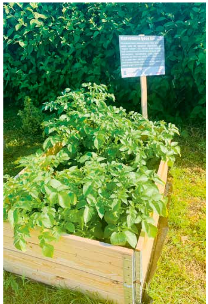
Selle aasta mais liitus lasteaed Eesti Taimikasvatuse Instituudi korraldatud kartuli kasvatamise projektiga.