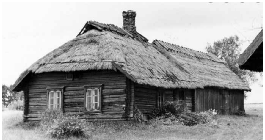
Kasutusluba ei vaja ehitised, mis on ehitatud enne 1995. aastat ja mida kasutatakse algsel eesmärgil.

Kuidas korraldada seni ehitisregistrisse kandmata ehitiste andmete korrastamist ning vajadusel ehitise seadustamist või lammutamist?