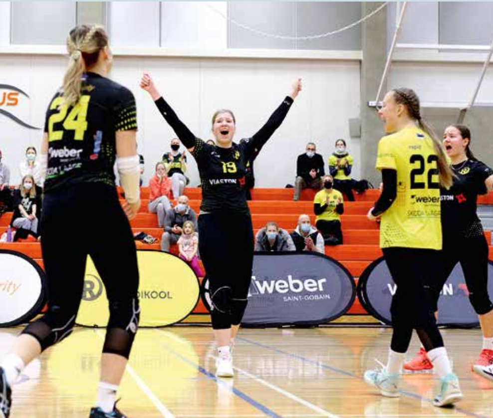
Rae Huvialakooli võrkpallitüdrukud rõõmujoovastuses.

lema, katsetada erinevate stiilide ja tehnikatega, ent teha seda väiksemas mahus kui põhiõppes.