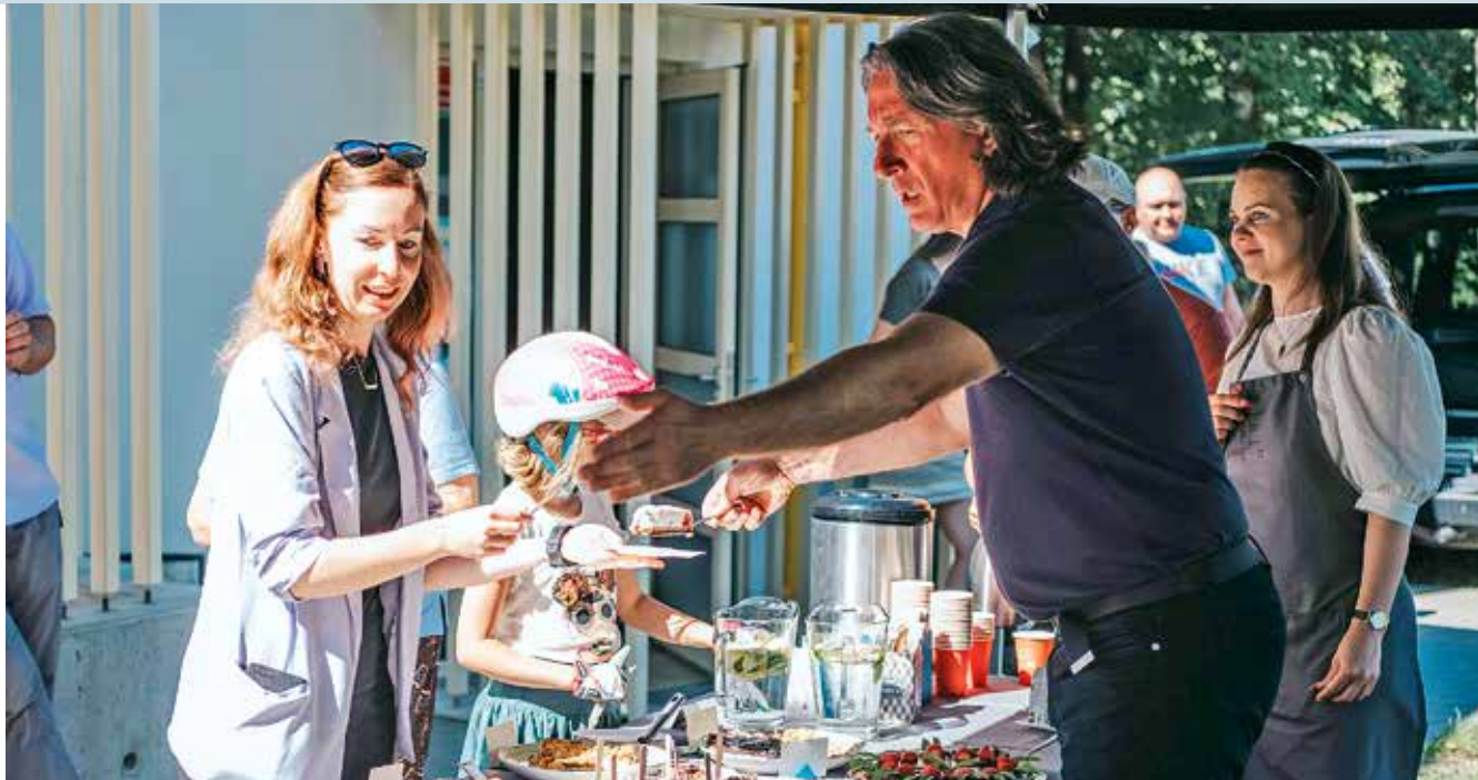
Rae valla taasasutamise 31. aastapäeva tähistamine algas vallavanema kohvihommikuga.