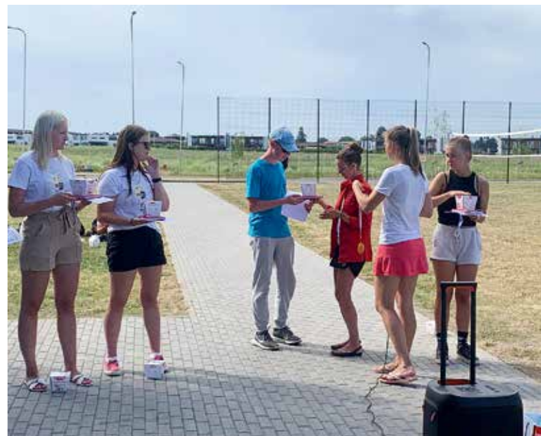
Õpilasmaleva I vahetus lõppes ühisüritusega, kus jagati tublidele malevlastele põnevaid tiitleid.