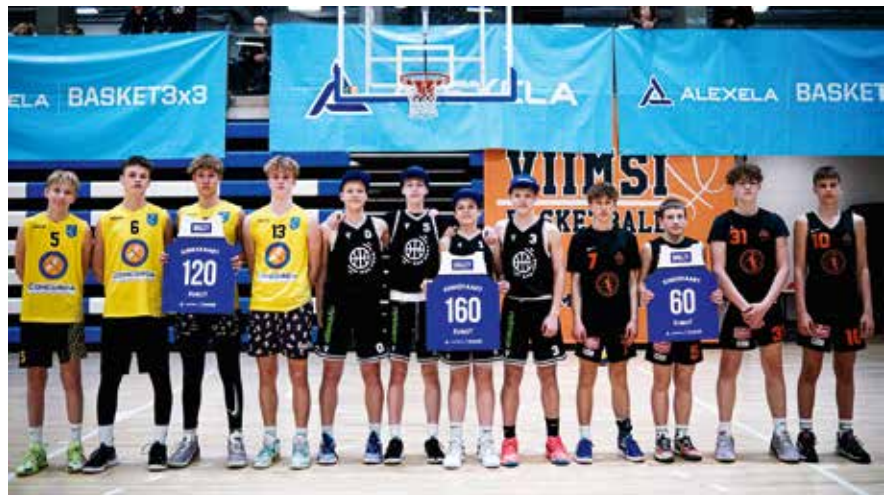
Rae/Nyimage U15 noormehed keskel.

kes osalevad kõikidel etappidel - Rae/Nyimage U15 ja Rae/Kiili SK U13. Siinkohal suur kummardus poistele, kelle initsiatiivil see toimub ja loomulikult lapsevanematele, kelle õlgadel on kogu logistiline korraldus. Tegemist on ikkagi kogu suve hõlmava pühendumisega, mis viib neid üle terve Eesti. Vanemate enda sõnul on tegemist toreda ja lõbusa ettevõtmisega, mis ei tundu üldse kohustusena. Väga meeleolukas on reisida mööda Eestit ning näha noori tegemas midagi, mis neile rõõmu pakub. Ja kui teha midagi nautinguga, siis tulevad ka tulemused, sest siamaani on igal etapil olnud poodiumitel!