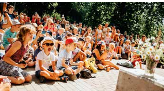
Soe suveilm tõi Lagedi Noortekeskuse ala noori täis.