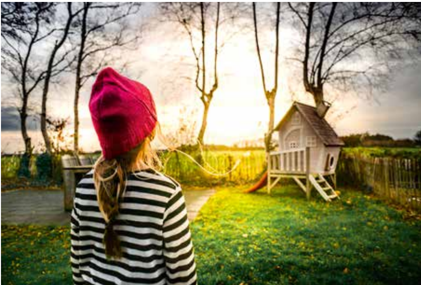
Vaba ehitustegevuse alla kuuluvate väikeehitiste, nagu näiteks aiamaa, kõrvalhoone või kuur, püstitamisel peab igal juhul pöörduma kohaliku omavalitsuse poole.

I ntensiivistunud ehitustegevusega koos on kasvanud ka abihoonete ja väikemajade ehitamise soov. Enne ehitise püstitamist peab aga uurima, kas soovitud ehitist on üldse võimalik püstitada ja millega peab ehitamisel arvestama.