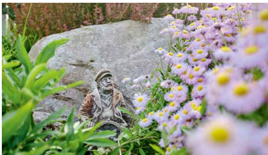
Aeda on kaunistatud erinevate detailidega. Kivi taga istuv kapten annab aimu perekonna seosest merega.