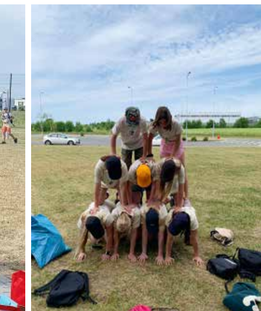
Malevas pandi proovile ka noorte koostööoskused.

korraldada mitmeid noortele suunatud üritusi, sündmusi ja projekte ning need on ka põhjused, miks suundusin tööle noorsootöötajaks. Otsustasin tulla tööle Rae valda noorsootöötajaks, kuna leidsin, et minu peatükk Tartus vajab lõpetamist ning soovisin edasi liikuda. Lisaks sellele, et tulen tööle Tallinna külje alla, suundun sügisest ka Tallinna Ülikooli, kus asun õppima noorsootöö korraldust. Seega kõik teed tõid mind Tallinna poole. Elukoha ja töökoha muutus on väga hirmutav, kuid samas ka väga-väga põnev. Usun, et Lagedi noortekas ootavad mind ees toredad ja aktiivsed noored, kellega saab olema lust koostööd teha. Mind ootavad ees uued ja suured muutused ning väljakutsed ja olen nendeks täielikult valmis!