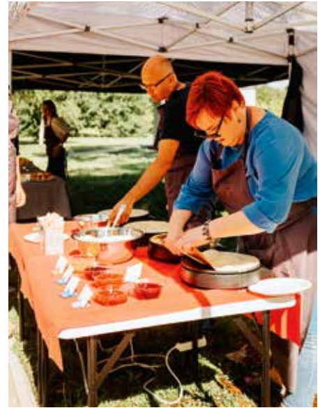
Vallamaja töötajad valmistasid kohapeal pannkooke.