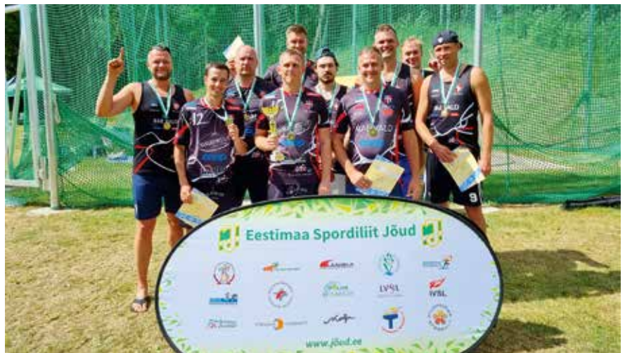
Võrkpallimeeskond kaitses eelmisel aastal võidetud esikohta edukalt.