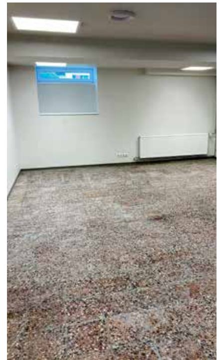
Ehituse 6 ruum.