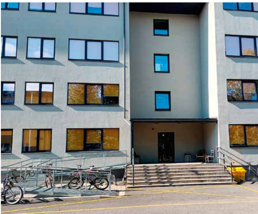
Ehituse 6 maja Jüris.