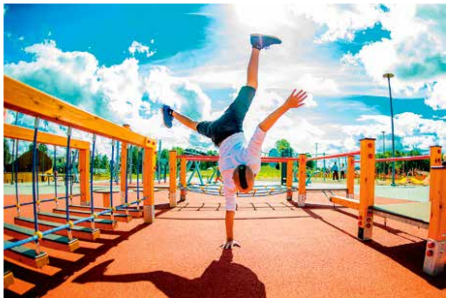
Tiptiptapi poolt loodud tasakaalurada Peetri pargis.