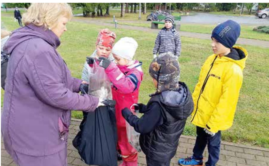
Vaida Kooli talgulised.