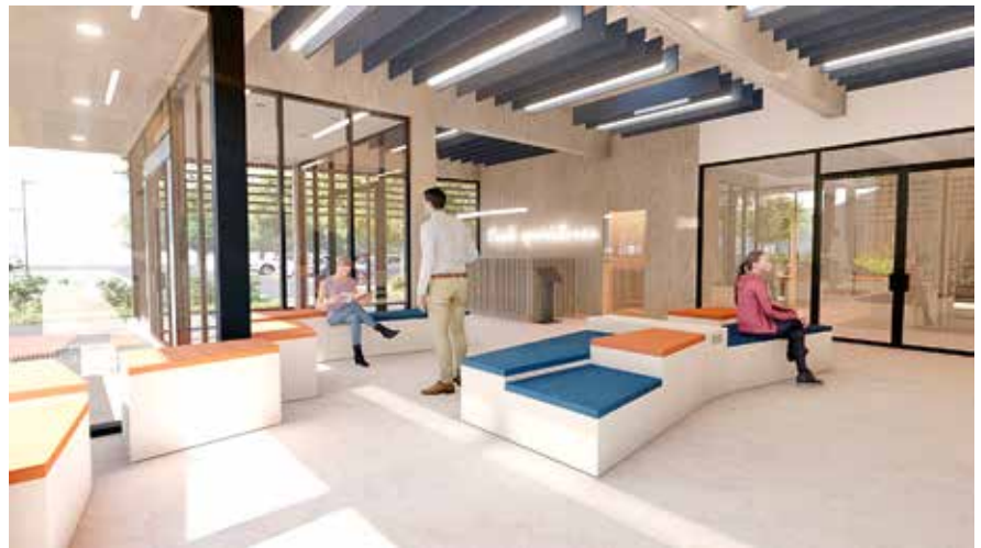
Spordihoone on kavandanud KOKO arhitektid.

Hoone on projekteeritud vastavalt majandus- ja kommunikatsiooniministri 29.05.2018 määrusele nr 28 „Puudega inimeste erivajadusest tulenevad nõuded ehitisele“ ning energi-aerikasutuse skaala järgi kuulub spordihoone A-klassi.