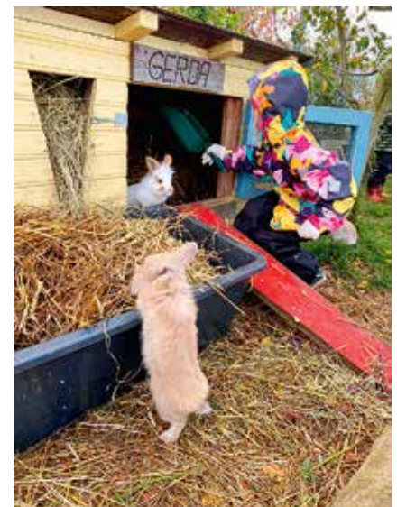
Lasteaia on oma jänkula, kus ülesanded on nädala kaupa rühmade vahel jagatud.

lõpetajatele medalite ning kingituste jagamine. Septembrikuu lõpus peetud Jüri lõppet tõi ka uue osalemisrekordi - 548 last!