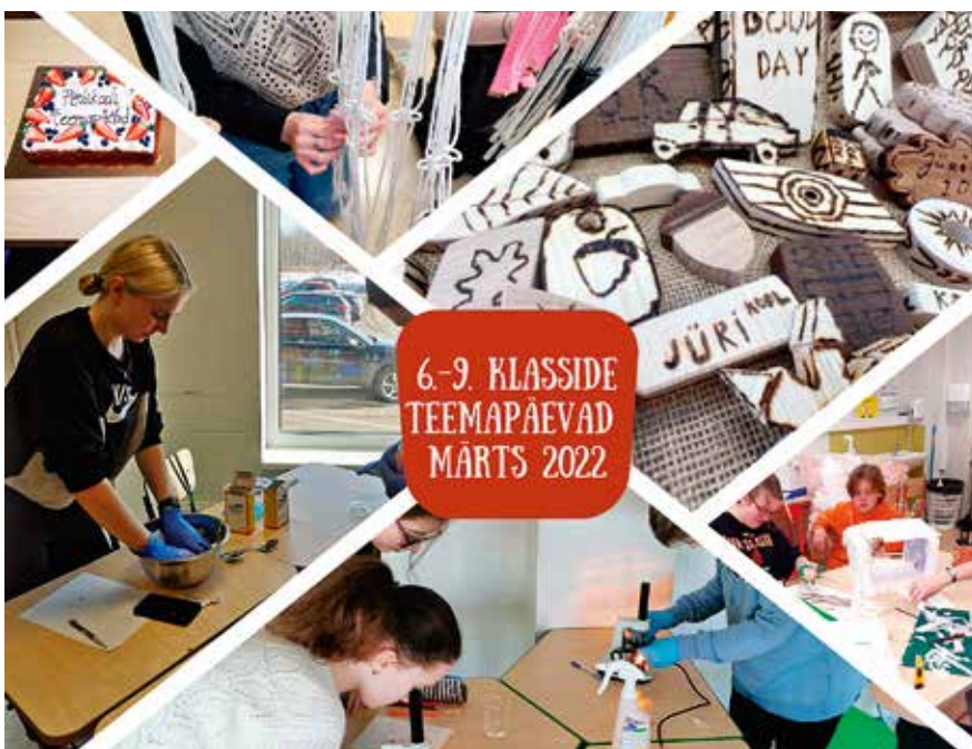
Aasta haridusteoks on Jüri Gümnaasiumi põhikooli teemapäevad.