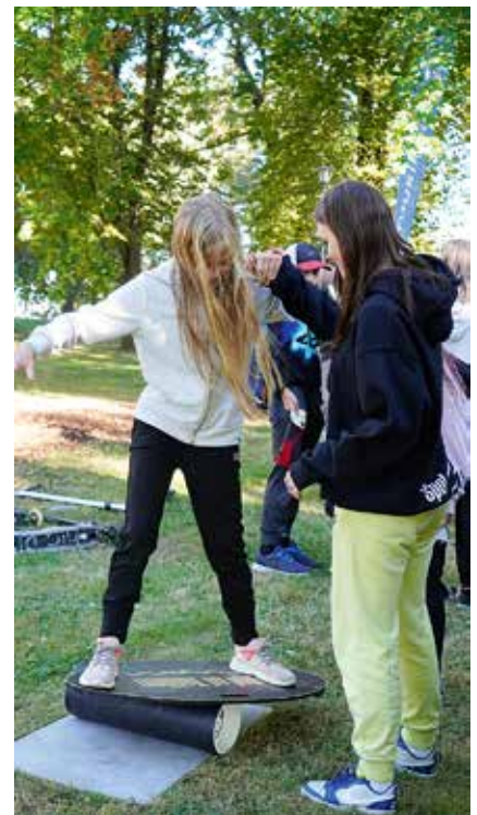
Noortele pakkus palju põnevust erinevate ülesannete lahendamine.