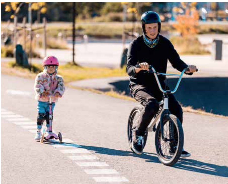
Kaspar ja Karolin skatepark 'is.

Kui nullist alustajad julgevad kolmekümnendates algust teha, siis julged ka sina, kes oled võib-olla seda mõtet mitu korda veeretanud. Tule skatepark 'i ja ehitad kindlasti oma lastega erilise sideme terveks eluks.