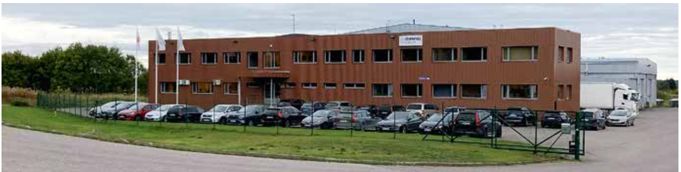
Maag Grupp asub Lehmja külas.

Rannarootsi Lihetööstus on kolmel järjestikusel aastal pälvinud Toiduliidu konkursi „Eesti Parim Toiduaine“ lihakategooria hõbemärgi „Eesti Parim Lihatoode“.