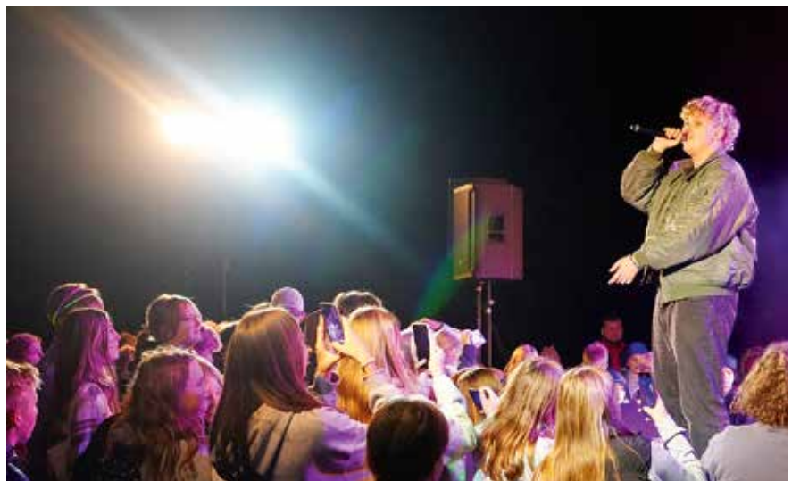
Clicherik & Mäx panid õhtule võimsa punkti.