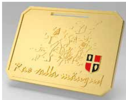
Rae valla mängude medali võitja selgitatakse 2024. aasta suveks.

Teine uus ala, kepphobusevõistlus viib osalejad ühtpidi tagasi lapsepõlve, kuid pakub paralleelselt meeleolukale formaadile ka füüsiliselt nõudliku väljakutse. Võistlus toimub 15. juunil praegu veel ehitusjärgus olevas Tuule