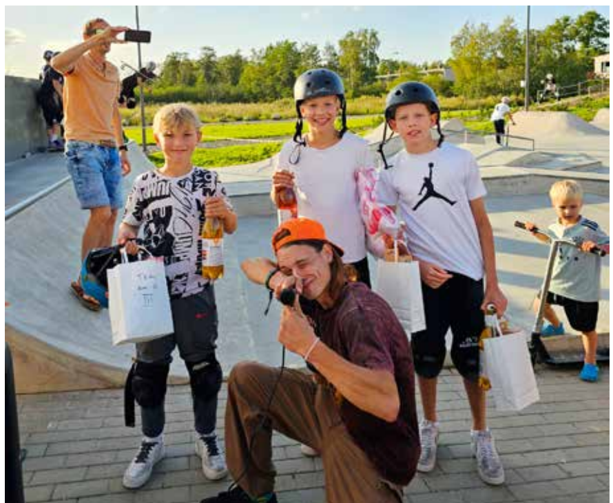
Kuni 13-aastaste noormeeste tõukerataste esikolmik.