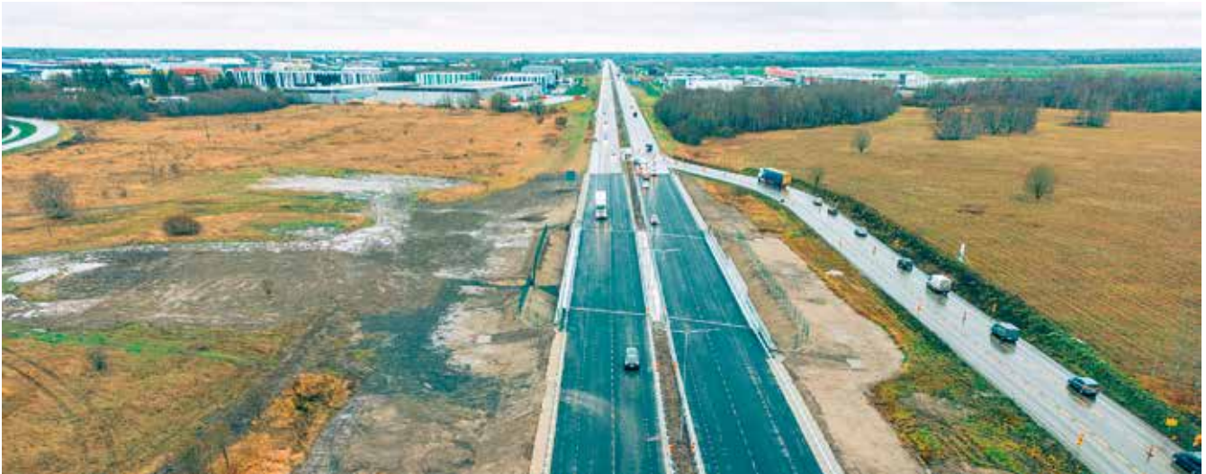
2022. aasta novembris avati Rae vallas Tallinna-Tartu-Võru-Luhamaa maanteel asuv Rail Baltica trassi ületav Assaku paarisviadukt.