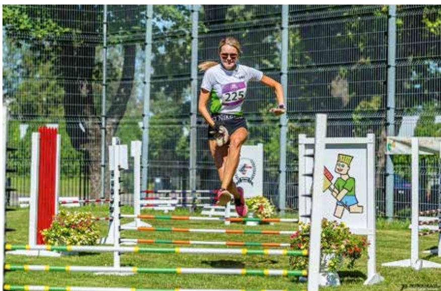
Kepphobusevõistlus viib osalejad ühtpidi tagasi lapsepõlve, kuid pakub ka füüsilist väljakutset.

Tosinast alast koosneva Rae valla mängude uus hooaeg algab septembrikuu viimasel päeval aastase pausi järel kalendrisse naasnud petankiga, mis asendab Mõlkkyt. Kettagolf kolib Kurna pargist eriilmelisele pop-up -rajale, mis saab püsti just selle võistluse tarbeks Peetri alevikus Pihlaka talus.