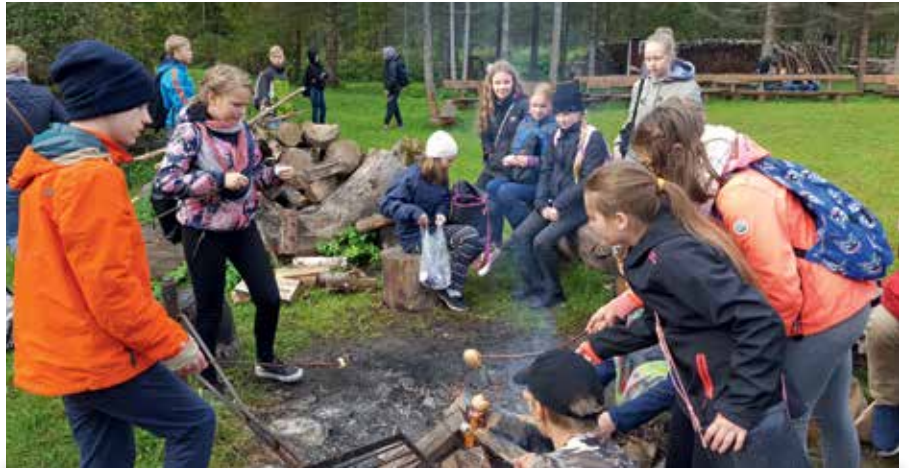
Jüri Gümnaasiumi 5.c õpilased tutvumas vee-elustikuga. Puhta Vee Teemapargis fookustatakse vastavalt klassile erinevaid teemasid – elu tiigis, putukad ja meemeistrid, orienteerumine loodusajaloolisel maastikul, taastuvenergia väikelahendused, Geotark Pandiverel, meelelunnid.

grupp läks tiigis elavaid veeputukaid uurima. Kõik püüdsid endale anumast ühe putuka ja uurisid seda luubiga. Mina uurisin suurt veemardikat ehk ujurit. Ujur oli paks, kiire ja tal oli kuus jalga. Tegime loomakese kohta töölehe, kus kirjeldasime tema välimust ja tegime ka luuletuse. Lõpuks saime ise tiigist putukaid püüda, see