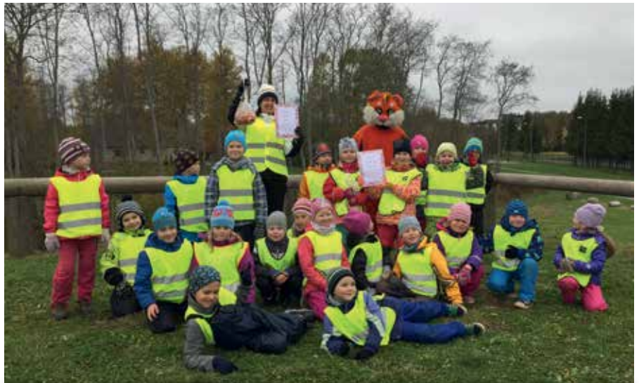
Tõrakese koolieelikute spordipäev Jüri terviserajal