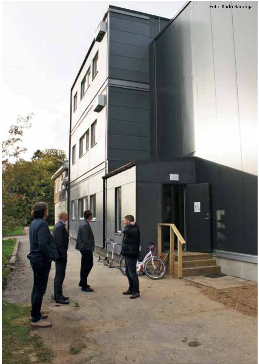
Harkujärve moodulkooli ruumid on soojad ja ventileeritud. Hoonet käisid uudistamas Rae vallavalitsuse juhid.

Võimlaga ühendatud moodulite peamiseks murekohtadeks on Riistopi hinnangul asjaolud, et vahetunni veetmiseks napib seal ruumi ja garderoobi puudumisel jäetakse üleriided koridori.