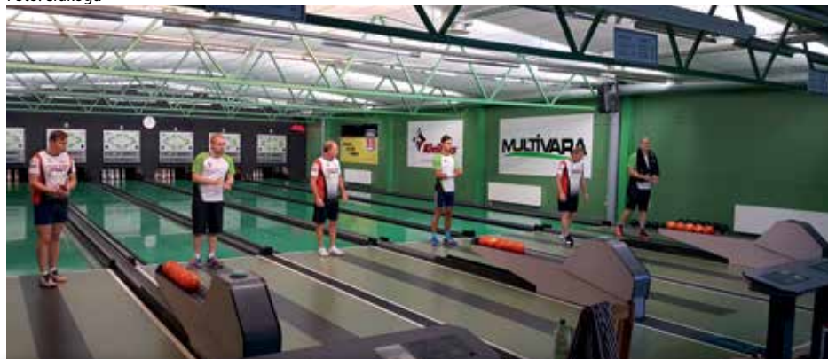
Peetri Spordi keeglivõistkond osales alanud hooajal esmakordselt Eesti võistkondlikel meistrivõistlustel sportkeeglis. Esimene mänguvooru vastaseks oli Tartu II meeskond.