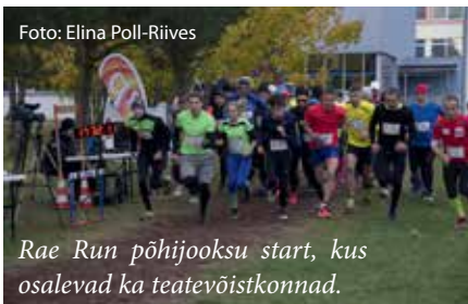
Rae Run põhijooksu start, kus osalevad ka teatevõistkonnad.