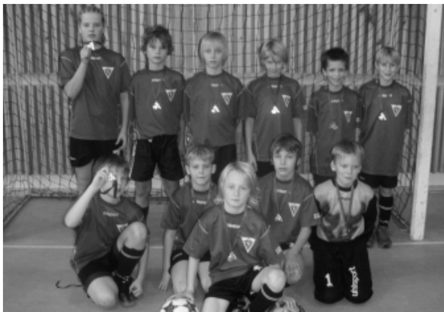
FC Jyri '93 võistkond näitab uhkusega võidumedaleid.

21. novembril võitis jalgpalliklubi FC Jyri 1993. aastal sündinud poiste võistkond Turbas, sealse jalgpalliklubi poolt korraldatud Turba Cup'i. Koguti 9 punkti ja väravate vahe oli 15:3. Teisele kohale jäi FC Kotkas ning kolmandale NJK Turba I võistkond.