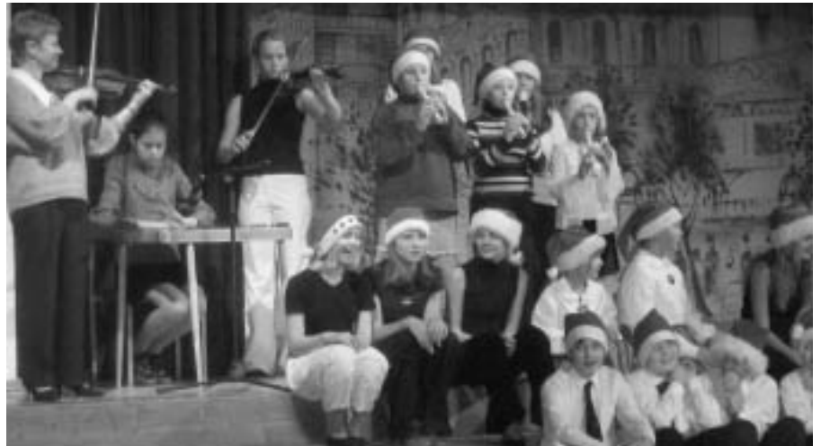
Kontserdi finaalis esines kapell looga Tiliseb, tiliseb aisakell .