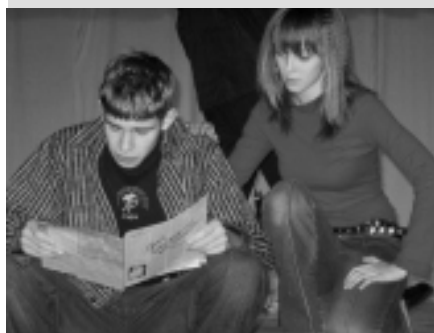
Jõhvi noorte emotsionaalne ja mõjuv etendus