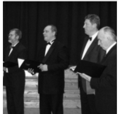
Kuivajõe meeskoor laulmas hoogsalt „jenkadi-jenkadi jõulud tulevad”.