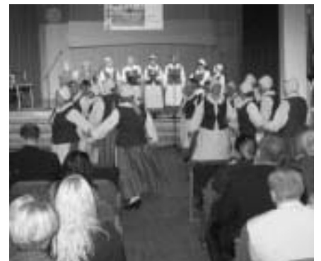
Lustiliste laulu- ja tantsuansambel esitab Abruka valssi.