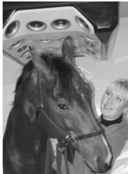
Esimene solaariumi külastaja oli koolisõiduratsu Freestyle.

Keskuse esindajad lubasid lustlikus meeleolus küsimusi esitanud ajakirjanikele, et järgmisena avatakse Jüris hobustele karussell ja vaateratas. Eesti Ratsaspordi Liidu apresident Ivari Padar arvas, et tänu nii võimsa solaariumi avamisele hakatakse Jüris kindlasti hobuste asemel seal haltuurat tegema ja päevitama võetakse hoopis ilusaid naisi.