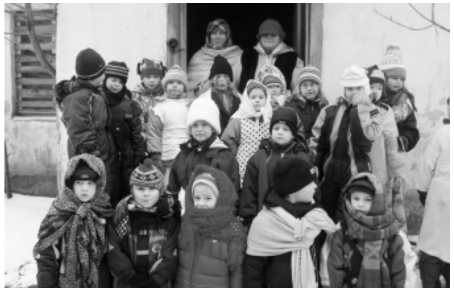
Kadripäevalised sajandivanuse majakese trepil.