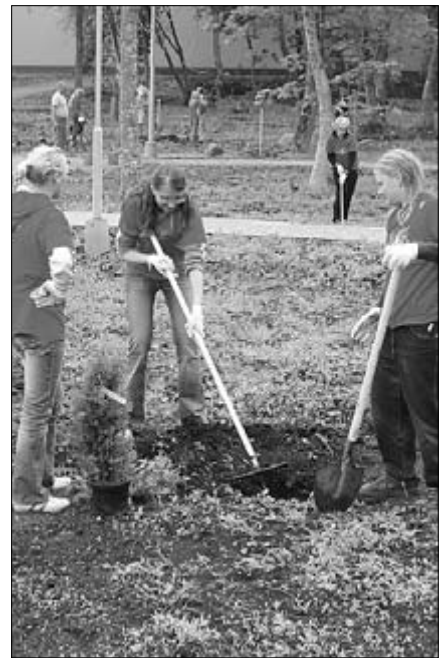
Õmmikad istutasid oma esimesel tööpäeval Kirikumõisa parki üle 100 puu.

Täname kõiki neid tublisid õmmi-veterane, kes kannavad mõtetes kui tegudes edasi maleva järjepidevust ning ei pelga koos tänase noortega üheskoos kodusõnna kaunistamiseks kätt mullaseks teha.