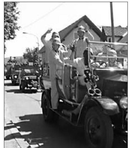
Pidulikul paraadmarsil osalesid 16 riigi vabatahtlikud tuletõrjajad.

1.-2. juulini toimus Väike-Maarjas Priitahtlike pritsumeeste foorum. Sellel kuulati ettekandeid Päästeameti edasisest reorganiseerimisest ja meie osast uuenevas Päästeametis. Vahetasime töökogemusi ning soetasime uusi tutvuseid. Olime tunnistajaks kahe tuliue päästeauto ristimisele ning nende üleandmi-