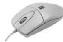
Optiline hiir A4Tech PS/2, valge