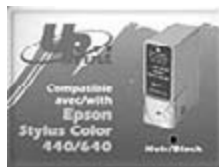
Epson must tint 440/400/640/jne