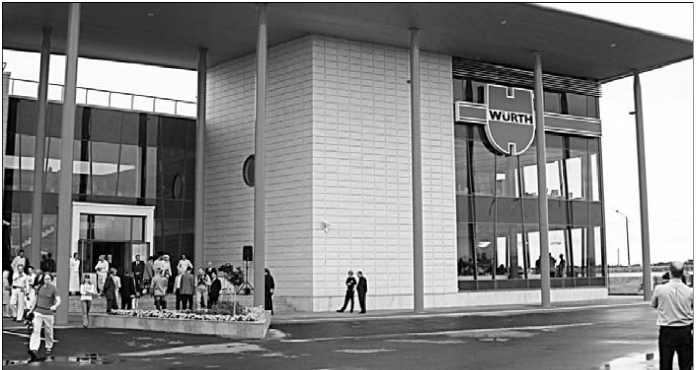
Ligi 60 miljonit krooni maksuma läinud AS Würthi uus peamaja ja laohoone võib saada tulevikus töökohaks nii mõnelegi meie valla inimesele.