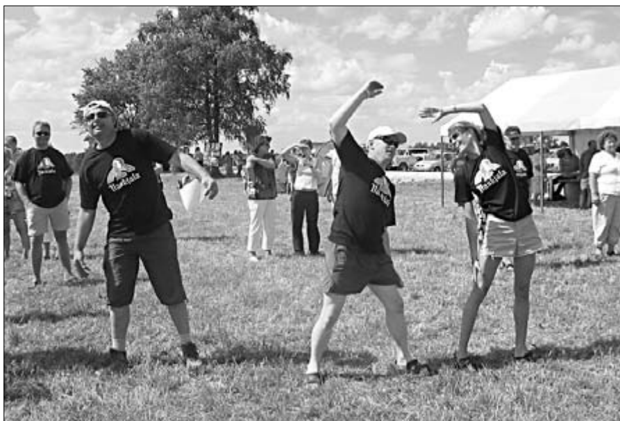
Külade päev algas ühise virgutusvõimlemisega, mille harjutused olid jõukohased nii noortele kui pisut vanematele