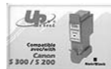
Canon must tint BCI-24bk