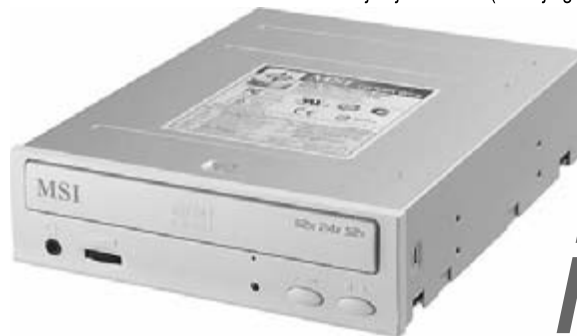
CD-kirjutaja CD-RW (uued ja garantiiga, aga ilma tarkvarata!) MSI MS-8352M 52x24x52