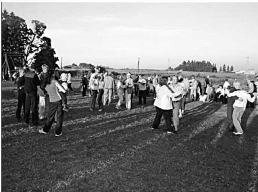
Tantsuplatsile ei pidanud Lagedi rahvast kaua paluma, ansambel „T&T” tegi mõnusalt rahvalikku muusikat.

Tantsides ja võisteldes kadus aeg kiiresti