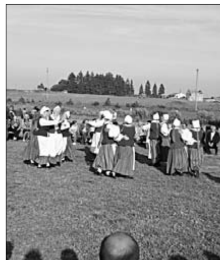
Jüri Lustilised töid Lagedile nii oma laulud kui tantsud.