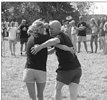
Teatevõistlused tekitasid rahva seas mõnusat elevust