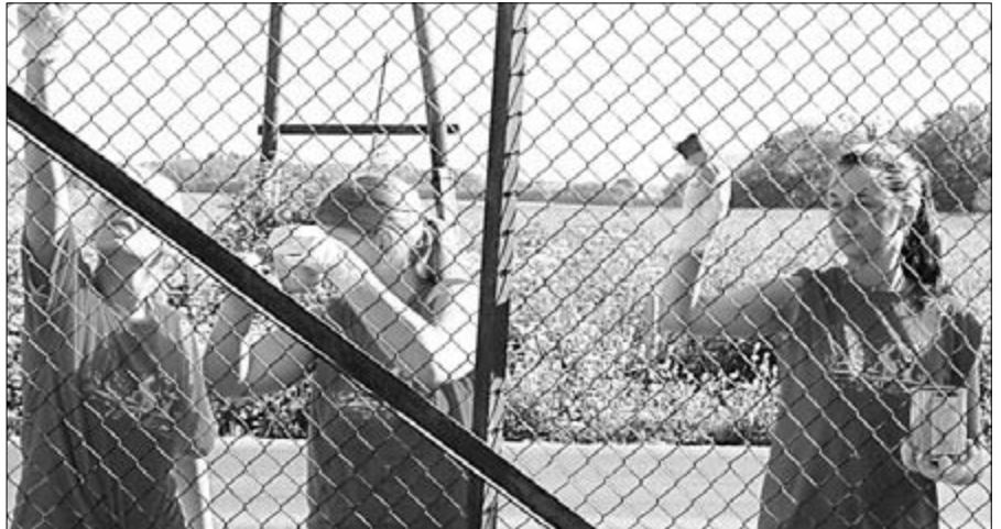
Jüri töörühm tegi värvimistöid Lehmja kooli juures, kus vana traataed sai uue näo.

Aasta tagasi kaalusin, et kas minna õppima edasi meditsiini või midagi keskkonnateemaga seonduvat. Selle aasta jooksul veendusin aga üha enam, et just viimane on minu jaoks õige valik. Nõnda viisin oma paberid TTÜ-sse keemia- ja keskkonnakaitse tehnoloogia ning Tallinna Ülikooli keskkonnakorralduse erialadele. Kuna sain sisse mõlemale erialale, tuli teha otsus ning selleks oli keskkonnakorraldus Tallinna Ülikoolis.