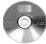
CD-R toorik 700MB Arita slim karbiga

Seega võib väita, et 20. juuli 2005 oli Rae vallale edukas päev, mida võib tulevikus lugeda Rae valla tähtsaima kooli taassünnipäevaks. Sümbolne on ka asjaolu, et see tähtis samm sai astunud aastal, mil haridustempel tähistab oma 25. tegevusaastat.