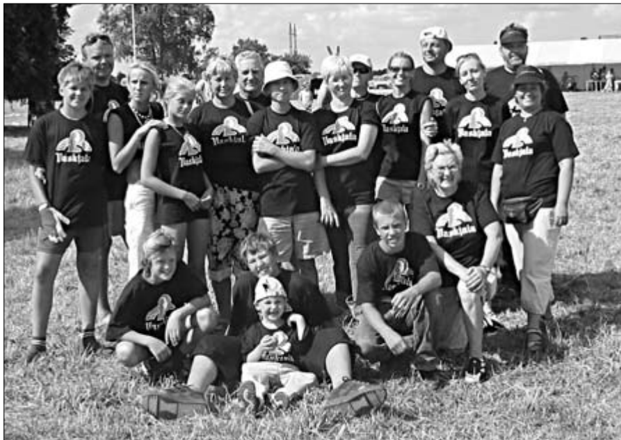
Vaskjala küla esindus oli suurearvuline ja stiilselt riides, üldkokkuvõttes võitis see seltskond mängudel teise koha