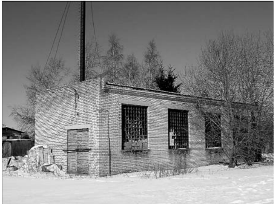
Suve algul hakkavad endises katlamajas suured ümberehitustööd.

Märtsi lõpus annab hoone projekteeija ETP Grupp vallavalitsusele üle lõplikud projektidokumendid. Lagedi keskuse üldpind on kokku 600 m 2 . Avaratesse ruumidesse mahuvad lahedasti ära raamatukogu koos eraldi lugemissaaliga nii täiskasvanutele kui lastele, võrreldes tänasega saab kohalik raamatukogu ligi kolm korda suuremad ruumid. Kõik Lagedi inimesed saavad internetipunkti-olevate arvutite kaudu vaba juurdepääsu internetile.