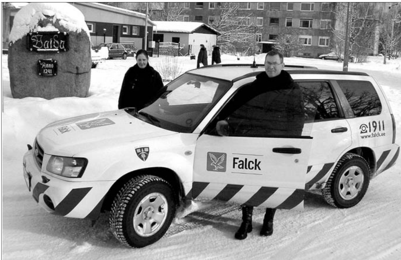
Lisaks pildilolevale ekipaazhile hakkavad Vaidas korda jälgima ka kaks videokaamerat.