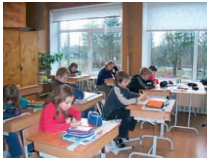
Lagedi Põhikooli 4. klass lugusid kirjutamas

5. – 9. klassile toimus veel kolmeosaline emakeeleviktoriin , mis tegelikult kujutas endast õpioskuste olümpiadi. Esimeseks osaks sai iseseisvalt valmistuda. Õpilastele anti emakeelepäeva, Kr. J. Petersoni elu ja tegevust ning eesti keele päritolu hõlmavad küsimused, mis oli