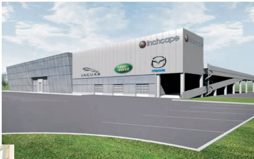
Inchcape uue esinduse välisvaade.

Tulevaste autokeskuste keskuseks kujuneva Tallinna-Tartu maantee äärde, Inchcape'i esindusse kolivad Tallinnas Akadeemia teel ja Kadaka teel olev Jaguar, Land Rover ning Mazda müügisalongid ja hooldus. Samuti viiakse uude kohta üle ka kasutatud autode müük.