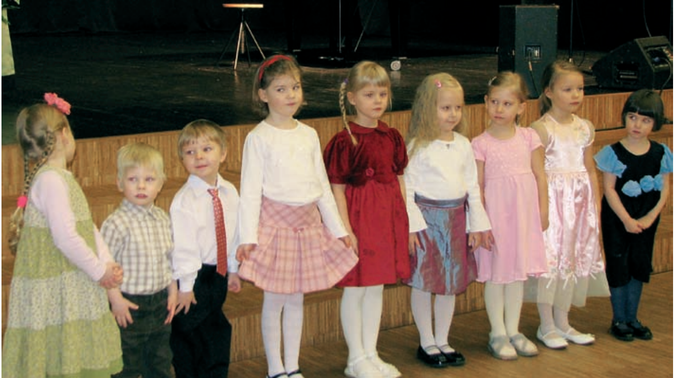
Vanuserühmades 3.-4. aastased ja 5.-6. aastased osalenud lapsed.

Parimad laululapsed selgitati välja 12. märtsil toimunud Rae valla laululapse võistlusel.