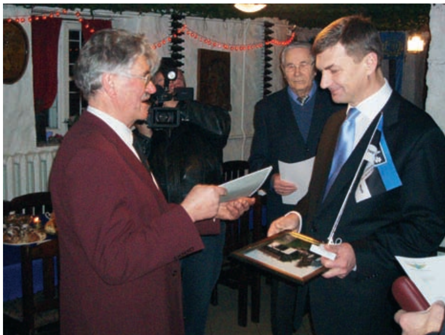
Peaminister Andrus Ansip külastas EVV Muuseumi ning istutas parki omanimelise tamme.