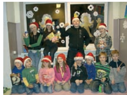
Lagedi Põhikooli pikapäevariühma jõulupidu.

18. detsembril toimus Lagedi koolis jõulupidu. Seal esitati näidendid „Jõululapsuke”, „Kingi igatsejad” ja „Tõehetk, jõulueri”, laulsid mudilas-, poiste- ja naiskoor,