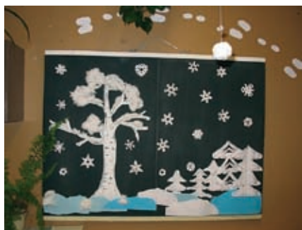
Valged jõulud Lagedi koolimajas.

1. – 5. detsembrini kaunistati koolimaja jõuludeks. Kaunistamise üldteemaks oli „Valged jõulud”. Žürii tunnistas selles tegevuses kõige paremaks 3. klassi.