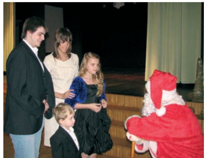
Jõuluvana sai kuulda nii suuremate kui ka väiksemate poolt ettekantud salme.

11. detsembril kogunesid Rae valla suurte perede ja puuetega lapsed kultuurikeskusesse jõuluvana ootama. Lastele esines tantsutrupp Modus huvitavate steptantsunumbritega. Pärast tantsuprogrammi lõppu kutsusid tantsutrupi lapsed tantsima ka jõuluvana ning pealtvaatajad. Tantsu ja tralli jätkus kuni jõuluvana kingikoti avamiseni, misjärel lapsed püüdlilikult luuletusi lugedes oma kommpaki lunastasid.