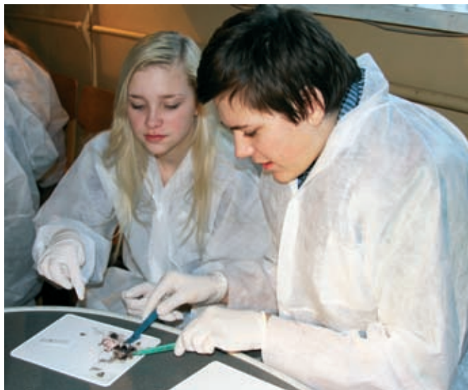
Silma lahkamine oli põnev kogemus.

Hiljem suundusid noored Tartu Lõunakeskusesse, kus suurel liuväljal end jõuetuks uisutada sai, misjärel suundusid noored 4D kinno erinevaid filme vaatama.