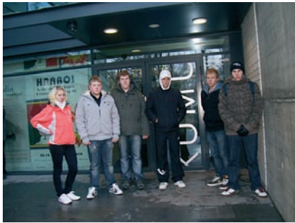
Lagedi kooli üheksandikud külastasid Kumus.

Kumusse plaanisime klassiga minna juba eelmisel aastal, nüüd, 19. novembril tegime kavatsuse teoks. Kumust lootsin leida huvitavaid maale ja tahtsin ka ennast harida.