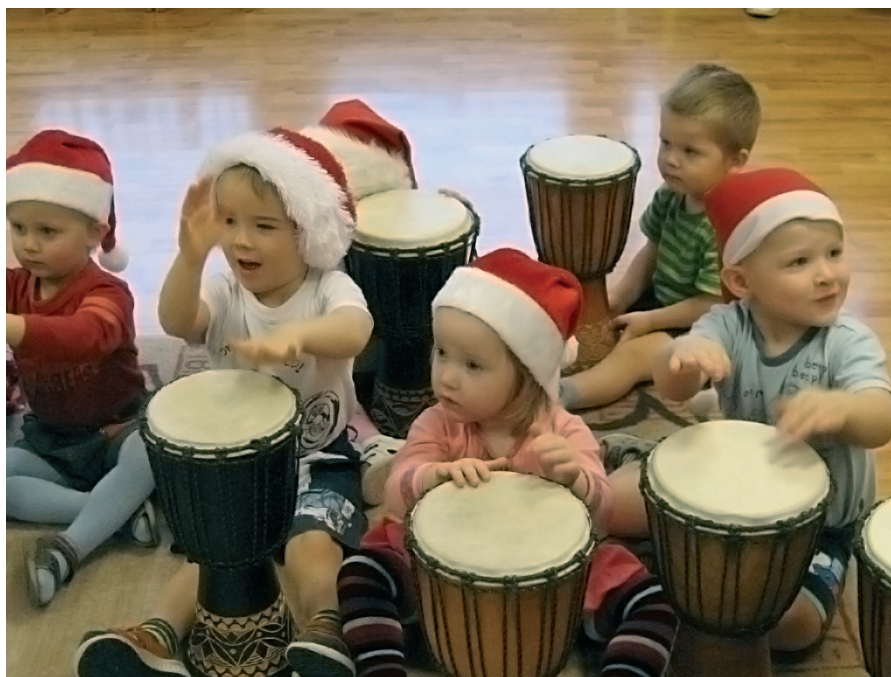
Djembe-trummimäng valmistas pisikestele suurt rõõmu.