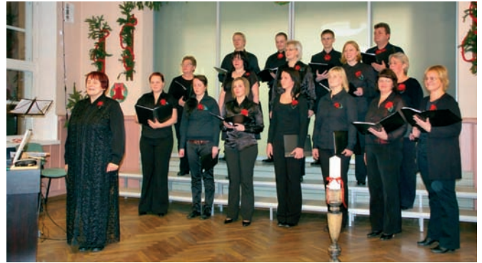
Lagedi koori esimene täispikk kontsert vääris tunnustust.