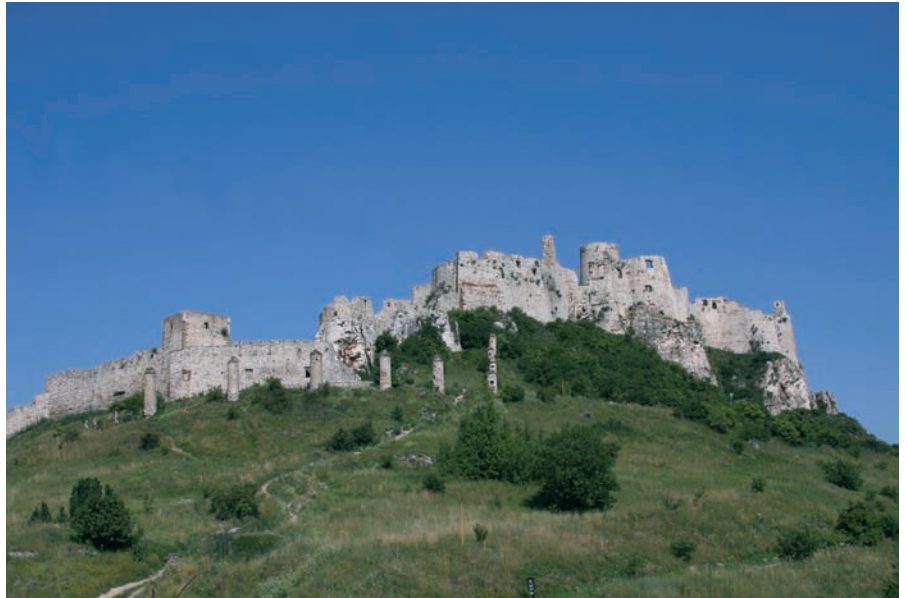
UNESCO kultuurimälestiste nimistusse kantud keskagegne Spišské linnus.

MTÜ Kodukant Harjumaa on viimastel aastatel oma eesmärgiks seadnud mittetulundussektoris tegutsevate inimeste koolitamist. On toimunud mitmepäevaseid koolitusi nii raamatupidamise, projektide kirjutamise kui ka n-ö enesemüügi alal. Need on enamjaolt olnud rahastatud Kohaliku Omaalgatuse (KOP) vahenditest. Oleme sinna kirjutanud erinevaid projektitaotlusi ja üldjuhul ka rahastuse saanud. 31. detsembril lõppes näiteks meil projekt „Enesemüük kui MTÜ-de ellujäämise üks alustaladid“, kus põhiorhk oli siiski raamatupidamise algõppel. On ju põhitõde, et meie kõigi igapäevane elu vajab eelkõige oskuslikku finantsilist juhtimist.