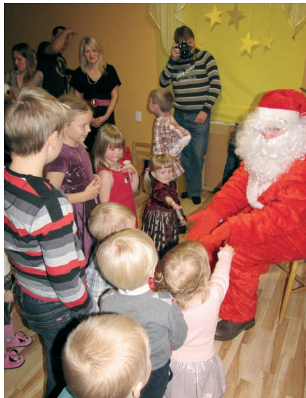
Jõuluvanaga kohtumine oli rõõmus ja julge tutvumine, oma kingipaki järele tulid teiste eeskujul ka need, kes punase kuuuga meest algul vaid eemalt vaatasid.

Janno Mikk OÜ Naljatilik juhataja www.naljatilik.ee