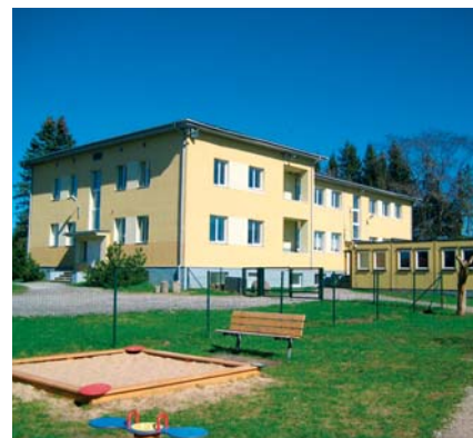
Praegune Assaku lasteaed – endine Lehmja kool.