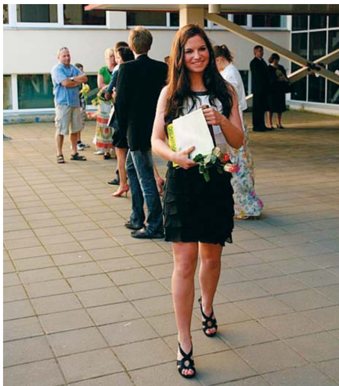
Kristin kooli ees.